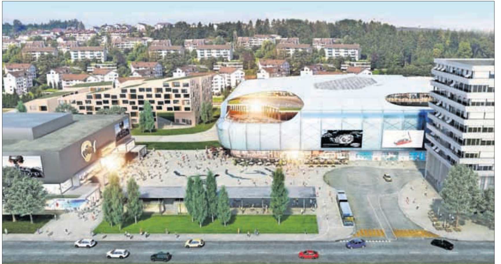
Mit der geplanten Mall of Switzerland in Ebikon, hier eine Visualisierung, soll eines der grössten Shoppingcenter der Schweiz entstehen.